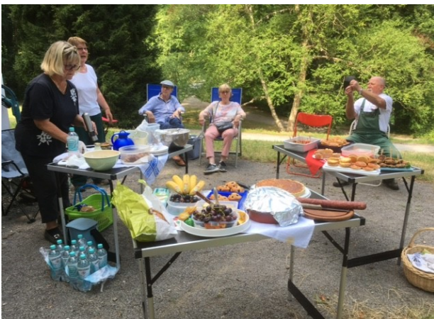
Abb. 2: Das Picknick ist gerichtet.

Gegen 12:00 Uhr als die Sonne am höchsten stand, waren wir dann froh, Feierabend machen zu können und es wurde begonnen das Buffet auf Tischen im Schatten vor dem Milchhäuschen aufzubauen (Abb. 2). Corona-gerecht wurden die mitgebrachten Stühle von den Mitgliedern auf Abstand rund um das Buffet aufgebaut.