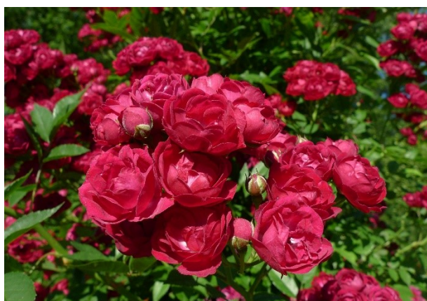
Abb. 1: 'Perennial Red Domino' (Tantau 2020).