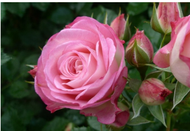
Abb. 8: 'Xenia' (Kordes 2020).

Bei den Minirosen gab es zwei Silbermedaillen für das Haus Kordes für 'Corazon' und 'Sternenhimmel' (jeweils 68 Punkte). Bronze ging an 'Spanish Caravan' (Rojewski, 62 Punkte).