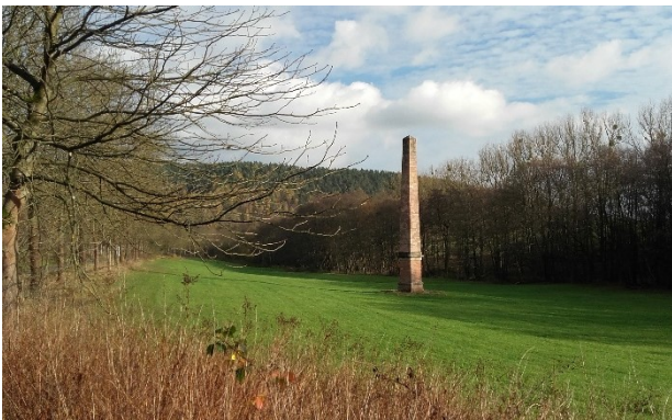
Abb. 16: „Lichtenstein“, 22 Meter hoher Obelisk aus Sandstein.

der Zeit des Landschaftspark bis heute beim Flanieren zu erleben. Im ehemaligen Landschaftspark sind wir eingeladen, die erhaltenen gestalteten Parkszenarien „den Liechtenstein“ (Abb. 16) und „den Inselteich mit Gedenkstein“ (Abb. 17) zu entdecken. Bei gesellschaftlichen Anlässen hielt man sich hier gerne auf und in der warmen Jahreszeit boten sie Aufenthaltsorte für ein ungestörtes „Stelldichein“. Nicht erhalten sind hingegen eine chinesische Brücke, ein Pavillon der „Clothildenruh“ genannt wurde, weitere kleine Steinbrücken, Grotten, lauschige Ruheplätze mit Moos und Steinbänken, ein Pavillon „Nanettenruh“, wahrscheinlich nach Clothildes Tante Antonia benannt, die Eremitage Heloise, wahrscheinlich nach Landgraf Konstantins zweiter Ehefrau benannt, ein Fass des Diogenes und ein „Regenschirm“.