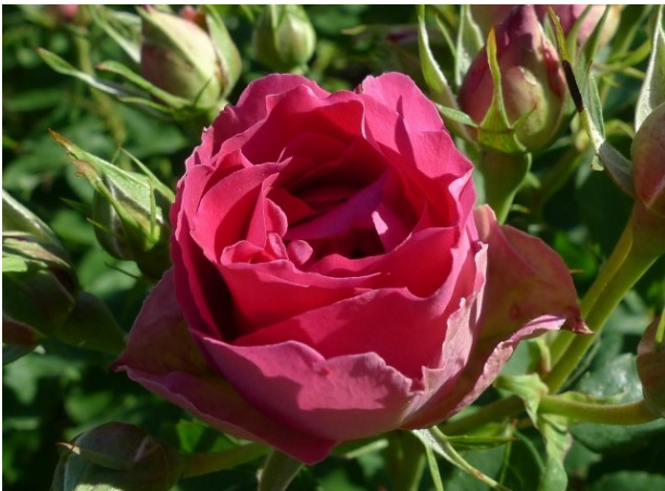
Abb. 14: 'Spanish Caravan' (Rojewski 2012).

In der für unsere Rosensammlung interessantesten Klasse der modernen Strauchrosen wurden die Rosen mit den Arbeitsnamen Vel17mpada (Lens, 67 Punkte) mit Silber und Evesorja (André Eve, 61 Punkte) mit Bronze ausgezeichnet.