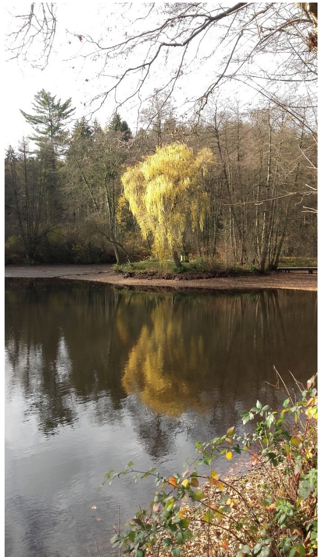
Abb. 17: Inselteich mit „Liebesinsel“.

Sehr schön gelegen ist der romantische Inselteich mit seiner „Liebesinsel“ (Abb. 17), auf der auch heute noch ein 1,35 Meter hoher altarähnlicher Sandsteinblock unsere Neugier weckt. In den Block ist eine herunterhängende umlaufende natürlich aussehende Bordüre gearbeitet. Auf der Vorderseite ist das Relief einer griechischen Amphore zu erkennen. In der Bordüre steht: