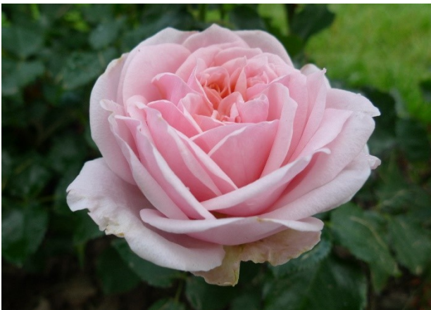
Abb. 7: 'Amorosa' (Kordes 2020).