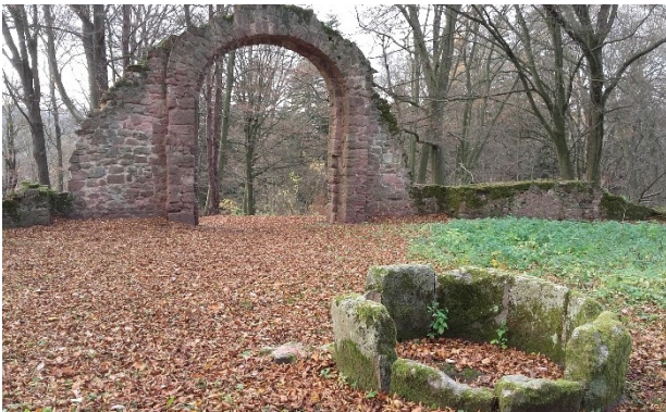
Abb. 15: Torbogen des Jagdschlusses Blumenstein.

Forst und Ruine kamen 1627 in den Besitz von Landgraf Moritz von Hessen-Cassel. Sie dienten der Versorgung der Söhne von Moritz und seiner zweiten Ehefrau Juliane von Nassau-Dillenburg. Das teilsouverän neu geschaffene Fürstentum Hessen-Rotenburg mit dem Amt Rotenburg und dem Bezirk Wildeck war von der Größe her ein Viertel der Landgrafschaft Hessen-Cassels, so entstand der Name Rotenburger Quart (lat.). 200 Jahre, von 1627 bis 1834, existierte das Quart, dann fiel der Besitz wieder an die Hauptlinie Hessen-Cassel zurück. Der letzte Landgraf von Hessen-Rotenburg, Victor Amadeus, starb ohne Nachkommen. Das Talschloss wurde auf Abbruch verkauft, das Bergschloss verfiel zur Ruine. Heute ist nur noch ein 1806 errichtetes Gästehaus erhalten. Was noch brauchbar war, wurde in den umliegenden Dörfern verbaut und genutzt. Vom Bergschloss blieben ein Keller an der Nordseite und der markante Torbogen am Zugangsweg. Der Torbogen ist heute Wahrzeichen der Gemeinde Wildeck (Abb. 15).