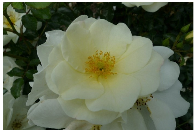
Abb. 11: 'Iwona' (Rojewski 2013).

In der Gruppe der Kleinstrauchrosen wurde nur eine Bronzemedaille an 'Iwona' (Rojewski, 64 Punkte) vergeben.