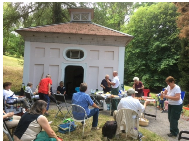
Abb. 4: Picknick in froher Runde.

In froher Runde und bei netten Gesprächen, nicht nur über Rosen (Abb. 4), wurde zwei Stunden alles gekostet und auch Rezepte untereinander ausgetauscht.