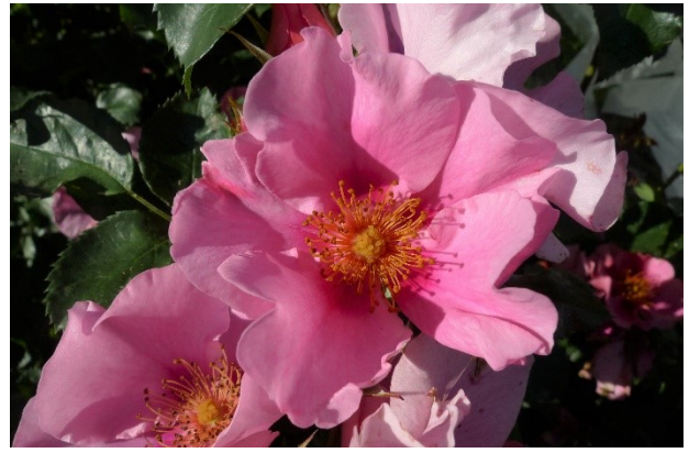
Abb. 9: 'SEE YOU in pink' (Kordes 2019).