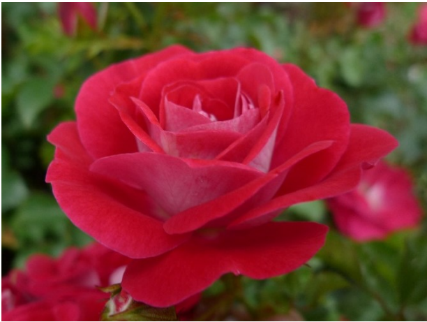
Abb. 12: 'Corazon' (Kordes 2020).