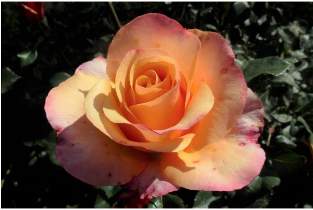
Abb. 6: 'Saloon' (Noack 2019).