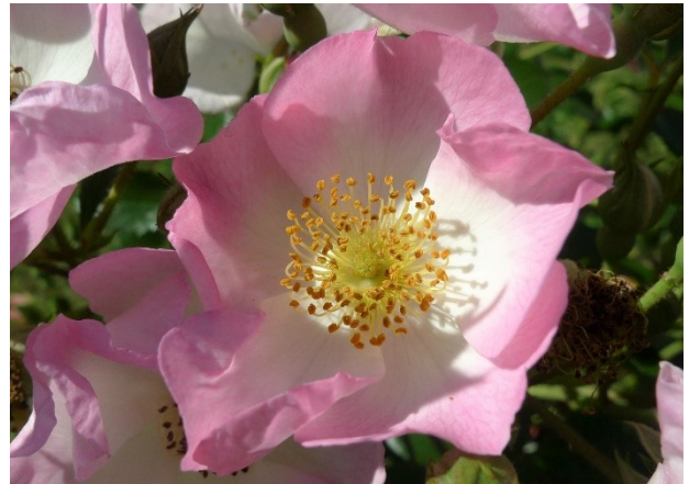
Abb. 10: 'Un grand Salut' (Vissers).

Gold ging bei den Floribundarosen an 'Xenia' (Kordes, 70 Punkte), Silber an 'SEE YOU in pink' (Kordes, 67 Punkte) sowie an 'Un grand Salut' (Vissers, 67 Punkte) und Bronze an den Arbeitsnamen VEL18fecab (Lens, 66 Punkte).