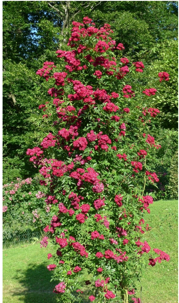
Abb. 5: 'Perennial Red Domino' (Tantau 2020).