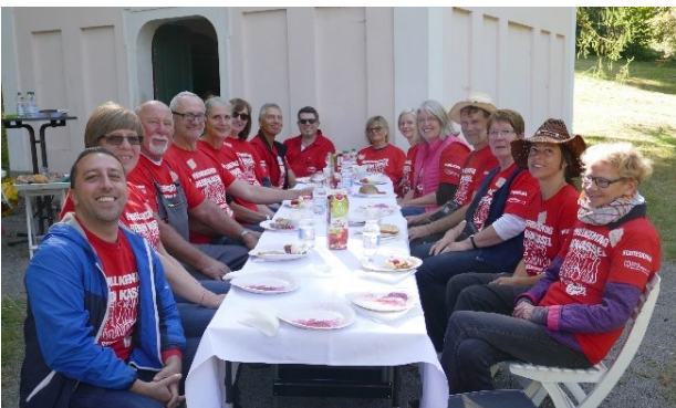
Abb. 3: Pause vor dem Milchhäuschen