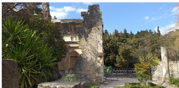
Park Jardin de la Fontaine in Nîmes

15:00 Uhr Kaffeetrinken, 16:00 Uhr Vortrag Dr. Wolfgang Schmelzer, Gästeführer, Kassel 'Frühling in der Provence' Vortrag mit Bilderpräsentation