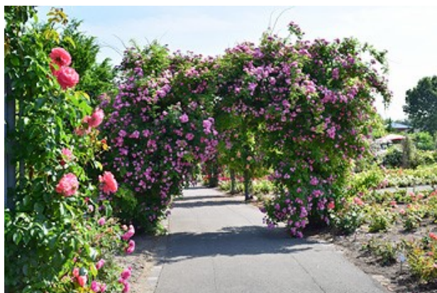
Der Rosengarten in Bad Langensalza