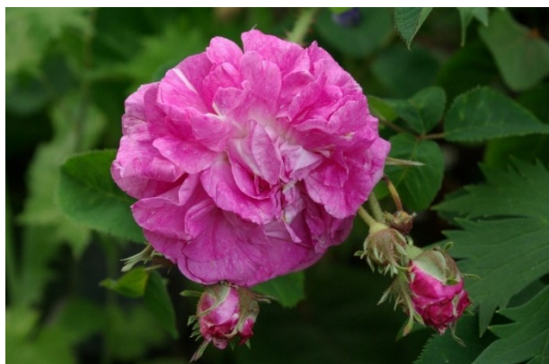
'Centifolie von Karlsruhe' - von Karlsruhe über Kassel nach Lauterbach