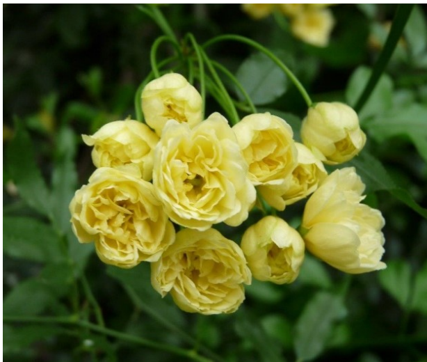
Abb. 5: Rosa banksiae var. lutea - 'Yellow Lady Banks Rose'