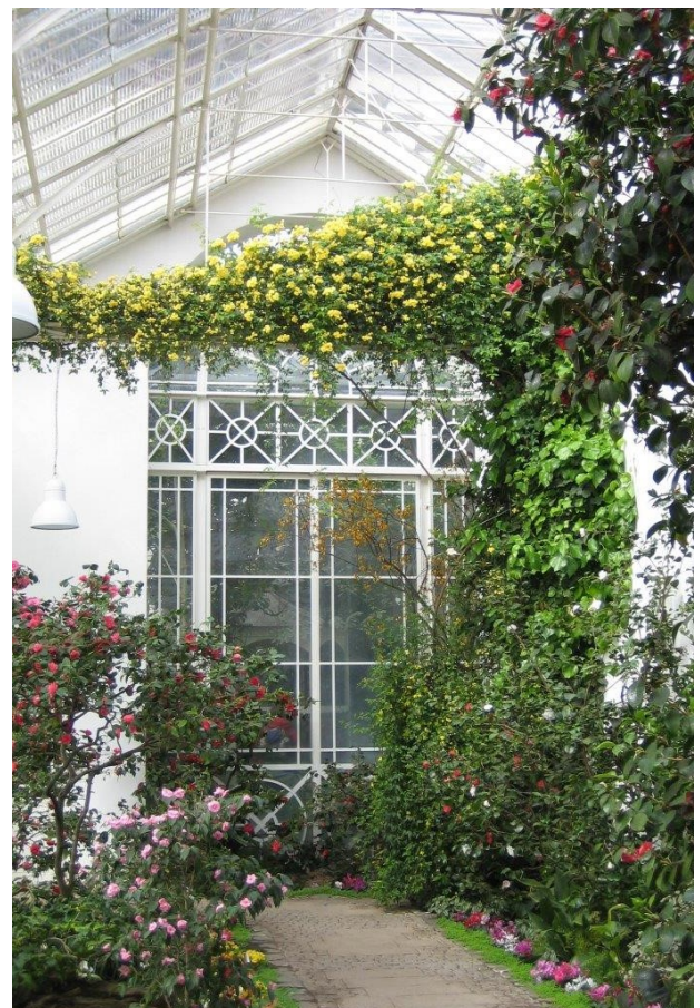
Abb. 4: Rosa banksiae var. lutea und Kamelien im Großen Gewächshaus.

Rosa banksiae var. lutea jedoch zeigt sich mit kaskadenartig herabhängenden Büscheln kleiner gefüllter gelber Blüten (von der Decke herunter hängend), es ist eine wahre Pracht. Das fast immergrüne glänzende Laub ist hellgrün und weich und besteht aus fünf Fiederblättchen. Rosa banksiae var. lutea hat keinen oder nur einen schwachen Duft und bildet keine Hagebutten.