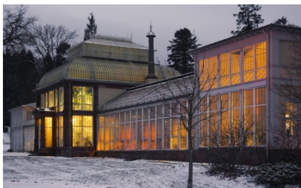
Großes Gewächshaus im Winter

Nur für Mitglieder und nach Anmeldung bei Elke Siebert