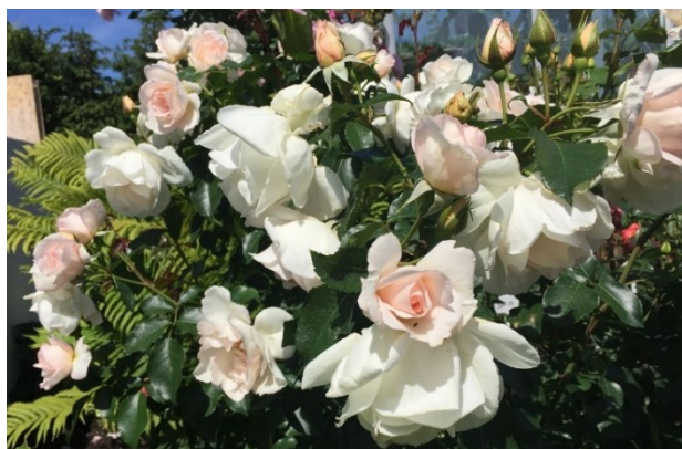
'Inger Forever' (Eskelund 2018 DK) Floribunda-Rose