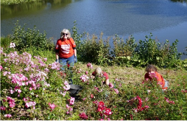
Abb. 2: Tatkräftiger Einsatz im Kleinstrauchrosenbeet auf der Roseninsel

triebe bei 'Herkules' am Ansatz auszugraben, mit Frau Siebert in Quartier 1 Rosen auszuschneiden und Wildkräuter zu jäten und mit Frau Waßmuth das Kleinstrauchrosenbeet auf der Roseninsel in einen gepflegten Zustand zu versetzen (Abb. 2). Frau Brenne und ich waren zuständig für die Organisation und die Verköstigung.