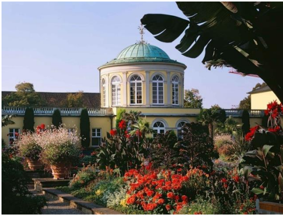
Blick auf den Schmuckhof im Berggarten