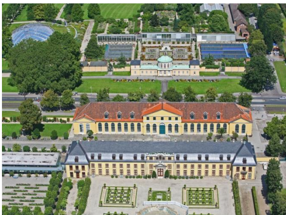
Luftaufnahme Großer Garten